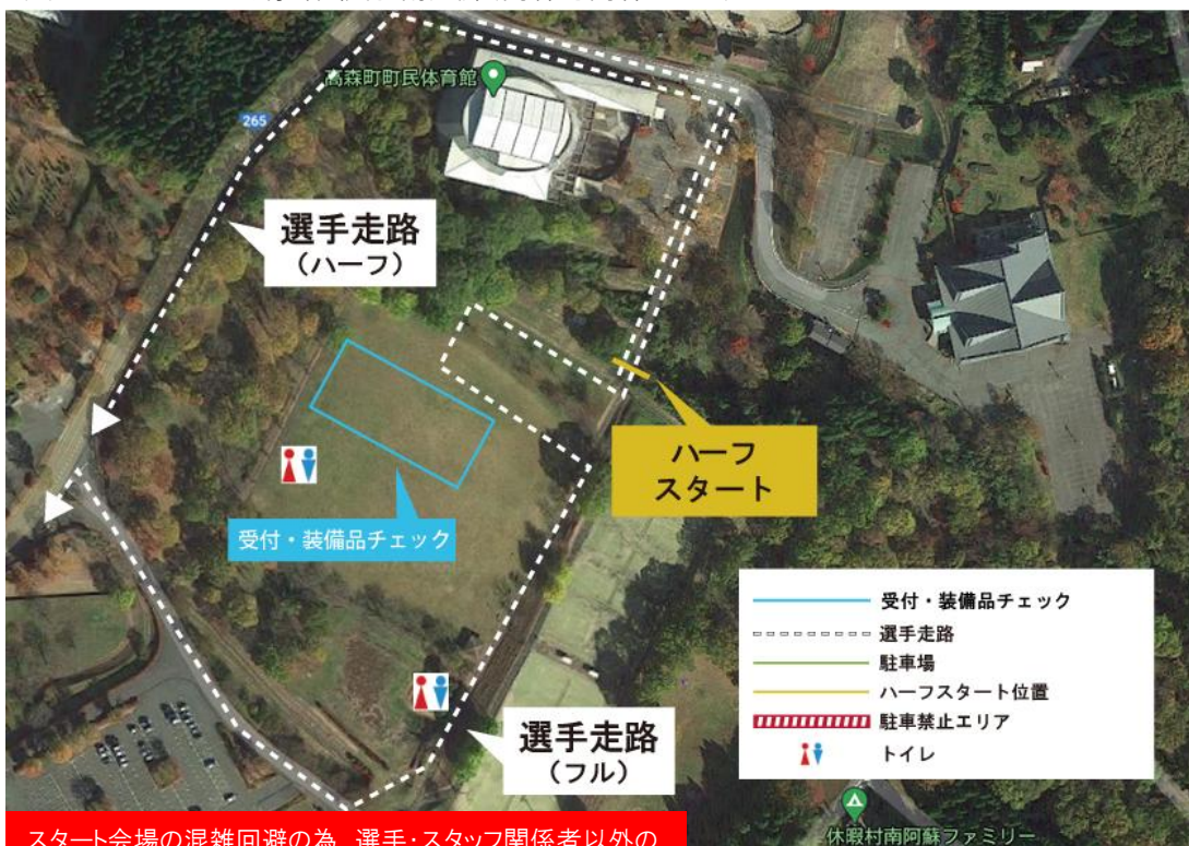
(4)ハーフスタート会場:休暇村 南阿蘇(高森町高森3219)

スタート会場の混雑回避の為、選手・スタッフ関係者以外の来場はお控え頂きますようお願い致します。