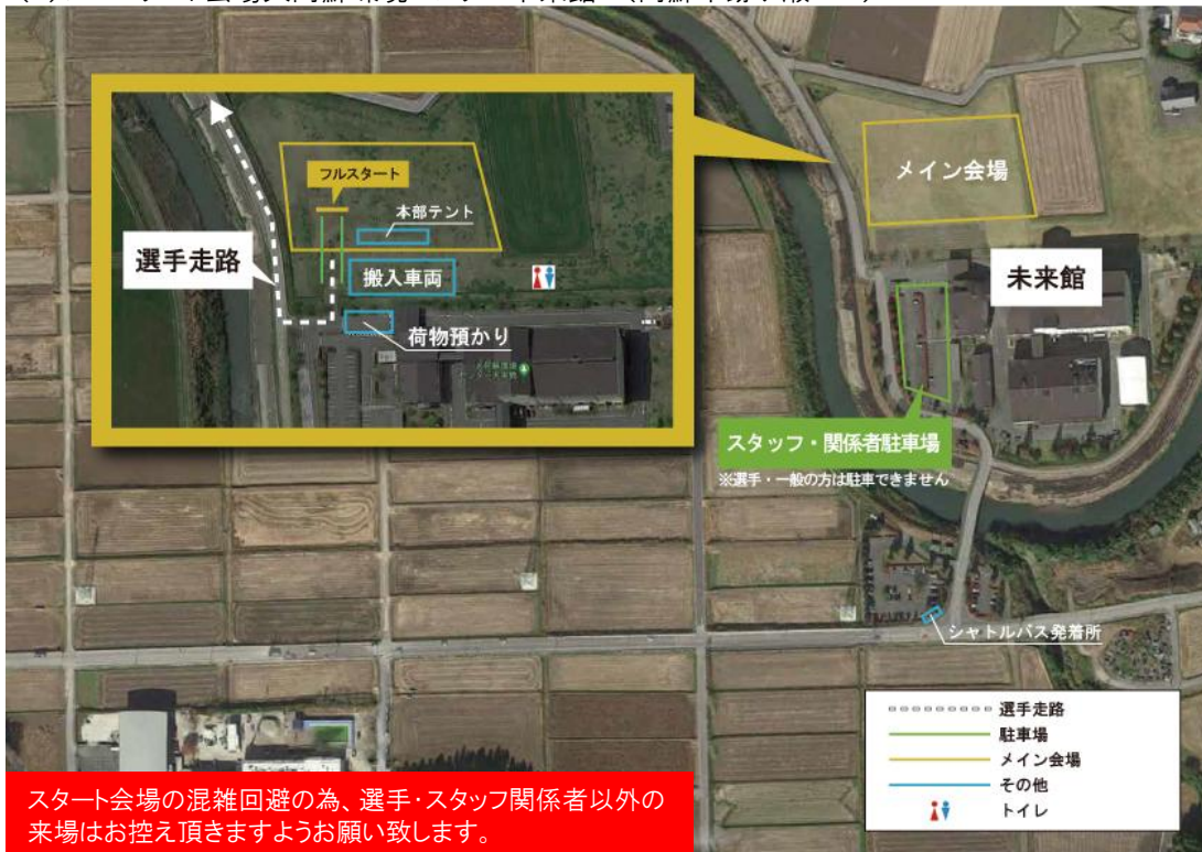
(3)フルスタート会場大阿蘇環境センター未来館：(阿蘇市跡ヶ瀬177)

スタート会場の混雑回避の為、選手・スタッフ関係者以外の来場はお控え頂きますようお願い致します。